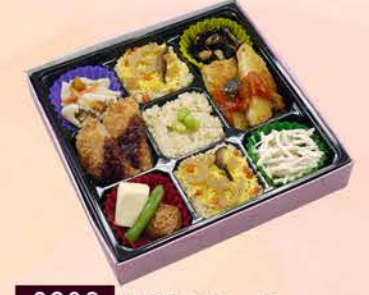
2098 (212X212mm) 五目御飯と2種のカツ弁当 税込 972円 (本体価格 900円) 味噌ひれかつとトマトチキンカツの2種類が楽しめるお弁当です。