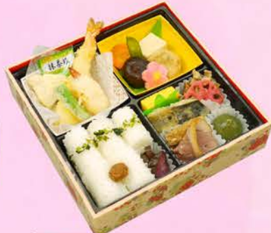
2096 (212X212mm) 花宴「はなのえん」 税込 2,160円 (本体価格 2,000円) 天ぷらや炊き合わせなどを彩りよく盛り付けました。会議をはじめ、冠婚葬祭にも重宝頂いております。