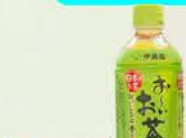
10030 伊藤園 PET350ml おへいお茶 税込 162円 (本体価格 150円)