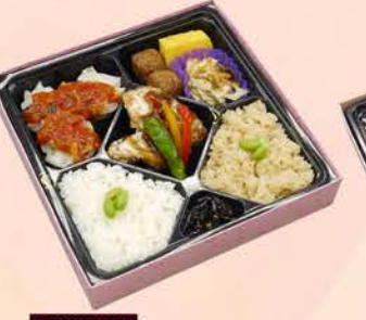
2099 (212X212mm) シューマイとサバ南蛮弁当 税込 972円 (本体価格 900円) トマトソースをかけたシューマイとサバ南蛮の、ご飯が進むお弁当です。