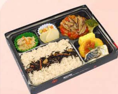
2101 (257X181mm) 和風トマトハンバーグ 税込 918円 (本体価格 850円) 和風な味付けのきのこトマトソースがマッチしたハンバーグ弁当です。