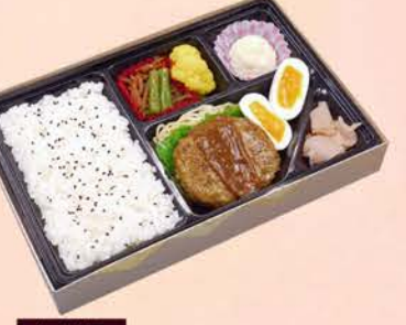
1417 (272X181mm) デミグラスハンバーグ弁当 税込 1,080円 (本体価格 1,000円) お弁当の定番ハンバーグを、デミグラスソースで中まで味がしみこむよう、煮込みました。