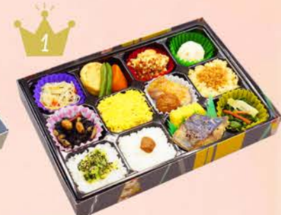
2086 (272X196mm) 浮舟「うきふね」 税込 1,080円 (本体価格 1,000円) 1番人気の12折弁当です。味はもちろん、彩り豊かなビジュアルもお楽しみください。