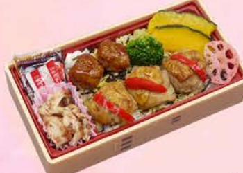
2085 (207X110mm) 彩やきとり弁当「いろどり」 税込 1,080円 (本体価格 1,000円) やわらかい焼き鳥をどんぶり風に仕上げたお弁当。色とりどりの野菜が食欲をそそります。