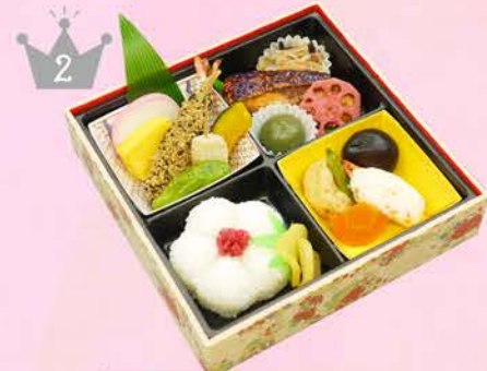
2104 (212X212mm) 梅枝「うめがえ」 税込 1,944円 (本体価格 1,800円) 海老の利休揚げと鯛の金山寺みそ焼きが絶品。会議や冠婚葬祭にいかがでしょうか。