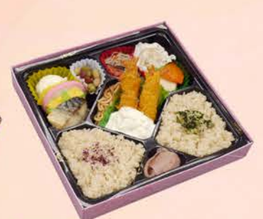
2102 (212X212mm) 洋風幕の内 税込 1,080円 (本体価格 1,000円) エビフライがメインの幕の内弁当です。タルタルソースをたっぷりつけてお召し上がりください。