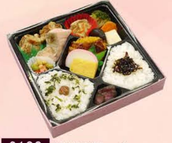
2100 (212X212mm) 定番幕の内 税込 1,080円 (本体価格 1,000円) 唐揚げや焼き鮭、コロッケ、煮物などお弁当の定番おかずを詰めた幕の内です。