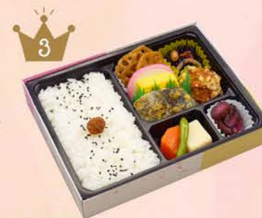
2093 (212X166mm) 夕霧「ゆうぎり」 税込 864円 (本体価格 800円) 自家製の鯖西京焼き、唐揚げ、ひじきなど、人気おかずを詰め込んだ王道の幕の内。