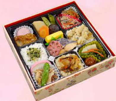
2095 (212X212mm) 紫「むらさき」 税込 1,512円 (本体価格 1,400円) 色鮮やかな和風おかずをふんだんに詰め込みました。会議や会合に最適です。