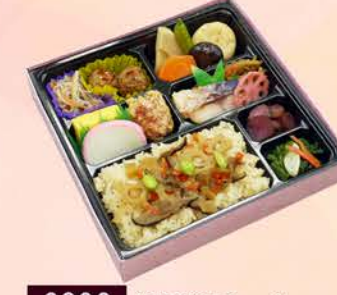
2092 (212X212mm) 撫子「なでしこ」 税込 1,080円 (本体価格 1,000円) 唐揚げや鯛の塩焼き、煮物などが入った、五目御飯の幕の内弁当です。