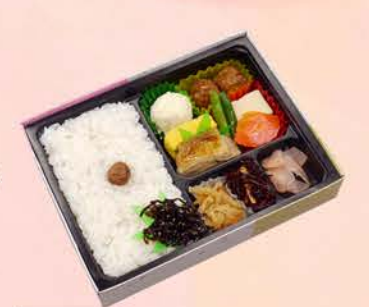
2082 (212X166mm) 横笛「よこぶえ」 税込 756円 (本体価格 700円) 鶏の照り煮や肉団子、煮物など、定番おかずを盛り込んだお弁当です。