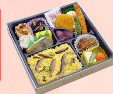
2088 (227X227mm) 雲居「くもい」 税込 1,188円 (本体価格 1,100円) 煮物、蒸し物、揚げ物、和え物などをバランスよく盛り込んだ、ボリュームなお弁当です。