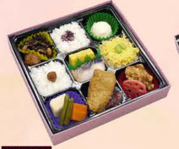
2087 (212X212mm) 花橘「はなたちばな」 税込 972円 (本体価格 900円) バラエティ豊かなご飯とおかずを詰め合わせた、人気の9折弁当です。