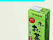
10047 伊藤園 ハック250ml おへいお茶 税込 108円 (本体価格 100円)