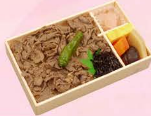
2106 (197X120mm) 牛肉すき焼弁当 税込 1,296円 (本体価格 1,200円) 関東風の割り下で炊き上げた牛肉をふんだんに盛り込みました。