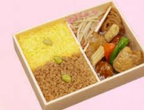
2090 (170X130mm) 若草「わかくさ」 税込 810円 (本体価格 750円) 2色丼と野菜が彩り豊かなお弁当です。特製焼き鳥でご飯が進みます。