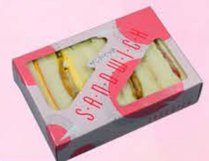
1423 (165X110mm) サンドウィッチ 税込 756円 (本体価格 700円) バラエティーに富んだミックスサンドです。ボックスタイプでもら運びにも便利です。