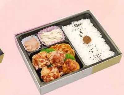
2094 (212X166mm) とりから弁当 税込 864円 (本体価格 800円) お弁当の定番、鶏の唐揚げをメインにした。自慢の唐揚げをお楽しみください。