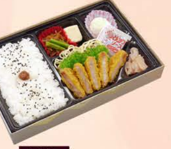
1415 (272X181mm) ひれかつ弁当 税込 1,080円 (本体価格 1,000円) やわらかくて美味しいひれかつです。しっとりとした肉感をとんかつソースでお召し上がり下さい。