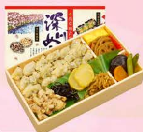
2097 (197X120mm) 深川めし 税込 1,080円 (本体価格 1,000円) 東京の名物深川めしをメインに、玉子焼きや煮物などを添えた人気のお弁当です。