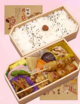
2084 (185X105mmX2段) 昭和おもひで弁当 税込 1,296円 (本体価格 1,200円) 昭和時代によく見られたお父さんのお土産がルーツの商品です。