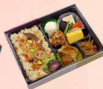
2083 (212X166mm) 柏木「かしわぎ」 税込 864円 (本体価格 800円) 唐揚げなどの定番おかずと五目御飯が楽しめる、幕の内風弁当です。