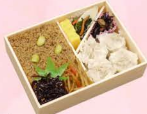
2105 (170X130mm) 大きなシューマイ弁当 税込 864円 (本体価格 800円) 大きなシューマイをぎゅうっと詰め込みました。そばろご飯と一緒に召し上がってください。