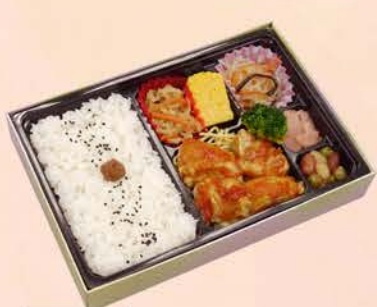
2089 (242X166mm) チキンのトマト煮込み弁当 税込 864円 (本体価格 800円) 自家製トマトソースでじっくり煮込んだ鶏もも肉が、ご飯によく合います。